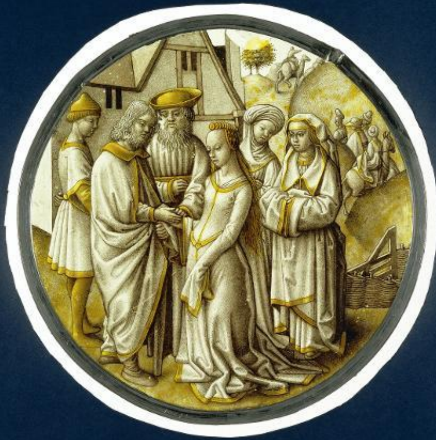
Ronde ruit met gebrandschilderde voorstelling van Abraham die het huwelijk van Izaäk en Rebekka inzegt. Het tafereel wordt gadeslagen door de zuster en de voedster van Rebekka.