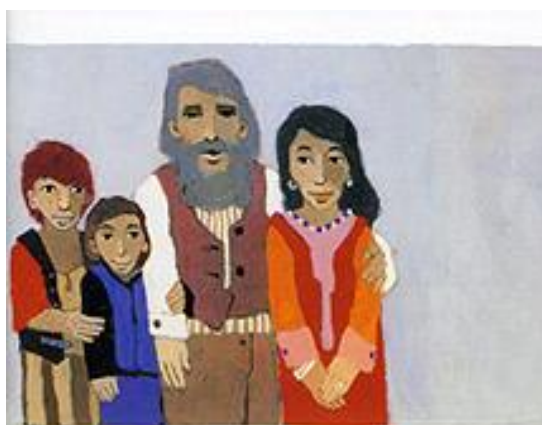
Jakob en Esau