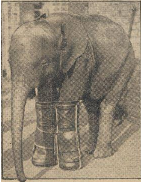
EEN OLIFANT MET ENGELSCHE ZIEKTE (zou 't een gevolg zijn van zijn verblijf in de Londensche dierentuin?) is zeker geen alledaagsch verschijnsel. De voorpoten van het jonge dier heeft men met lederen „manchetten” gesteund.