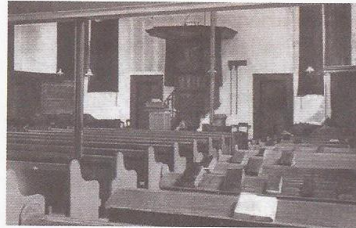
Gereformeerde Gemeente te Lisse

Op 8 november 1898 arriveerde in Lisse een telegram met de verblijdende inhoud dat hij het beroep aannam. Op dezelfde dag schreef hij een uitvoerige brief aan de kerkenraad waarin hij vermeldde hoe de Heere hem duidelijk de weg naar Lisse gewezen had. Op