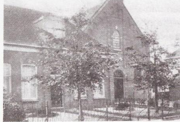
Gereformeerde Gemeente te Lisse