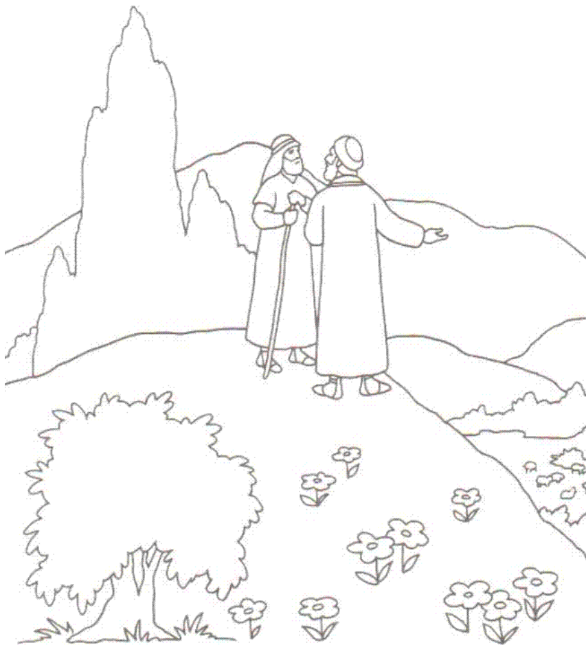
Abraham en Lot