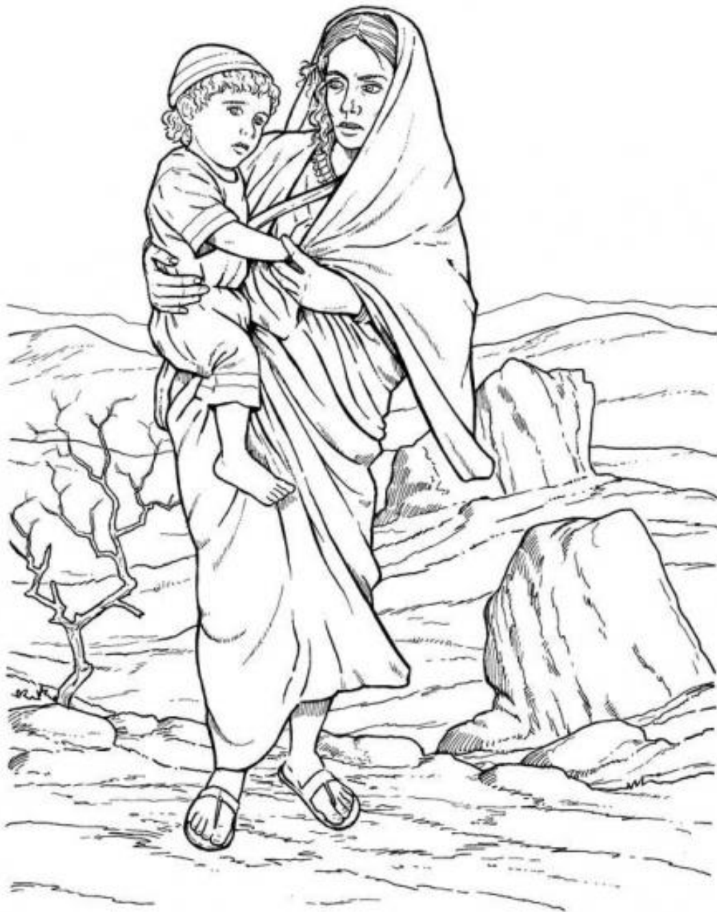
Kleurplaat: Hagar en Ismael