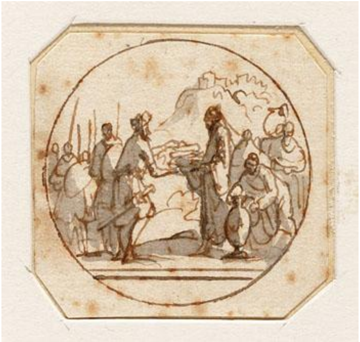
Abraham ontmoet Melchizedek