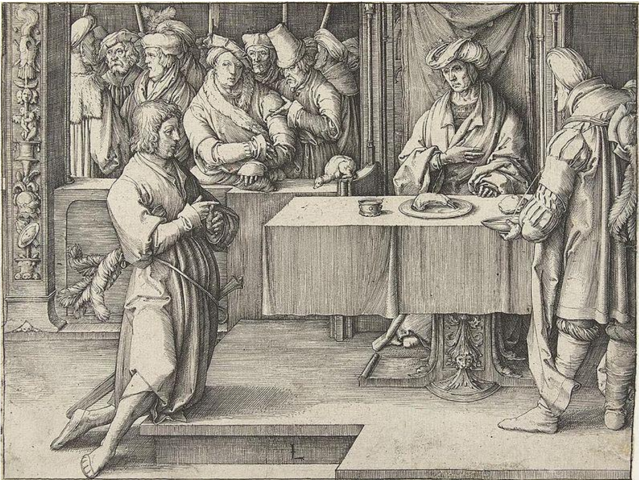
Jozef verklaart de dromen van Farao. 1512. Gravure. 12,6 × 16,6 cm. Amsterdam, Rijksmuseum