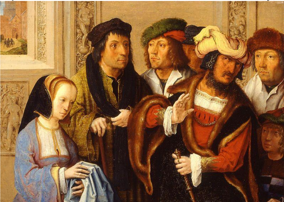
De vrouw van Potifar toont haar gemaal de mantel van Jozef. Ca. 1512.