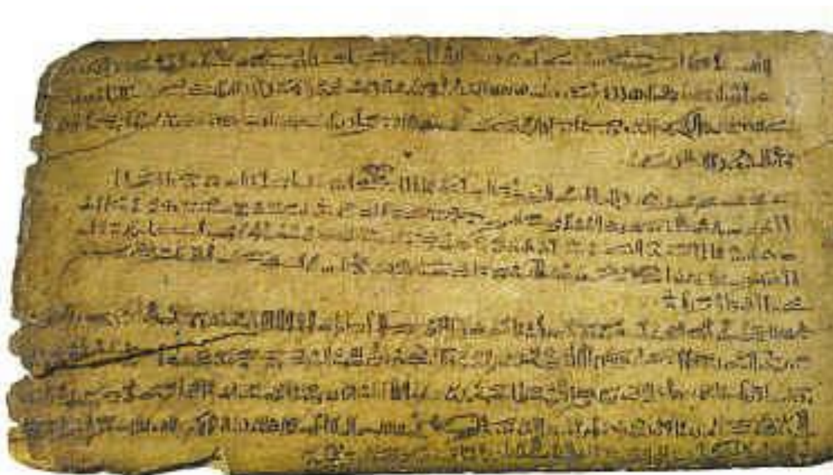
Op deze steen staat het verhaal van Jozef