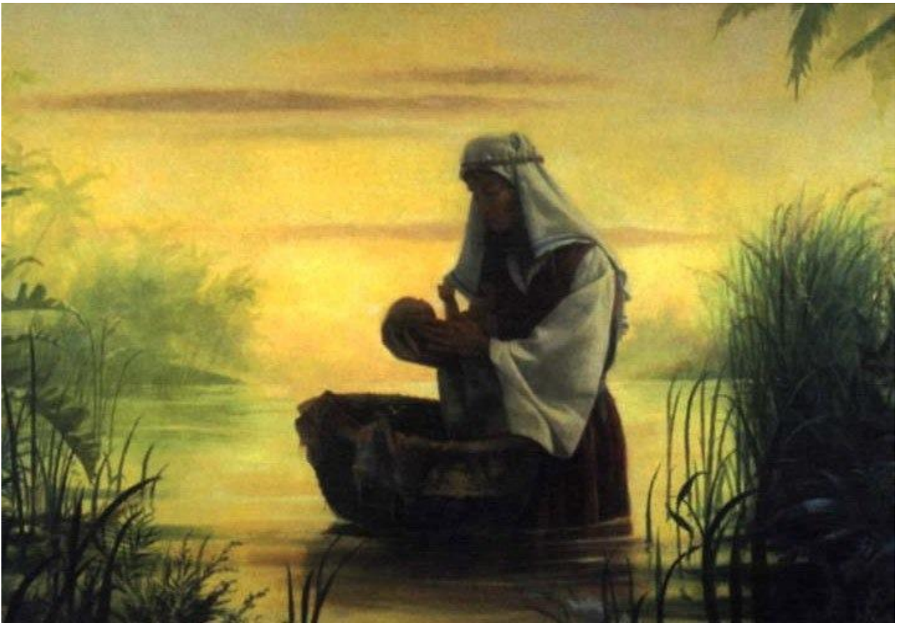
Jochebeth legt baby Mozes in rieten mandje