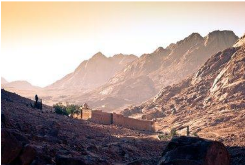
In de voetsporen van het volk Israel

Dan komt er weer een bevel van God aan Mozes en Aäron. Ze moeten zich aan Farao laten zien, als hij 's morgens vroeg naar de Nijl gaat. Dan moeten ze tot hem zeggen: Zo zegt de Heere: Laat Mijn volk trekken, dat zij Mij dienen.