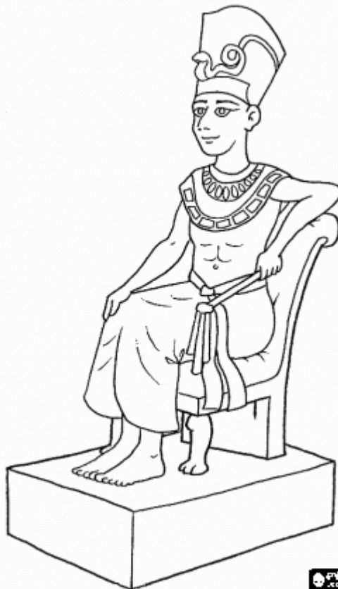
Farao 's hoge troon