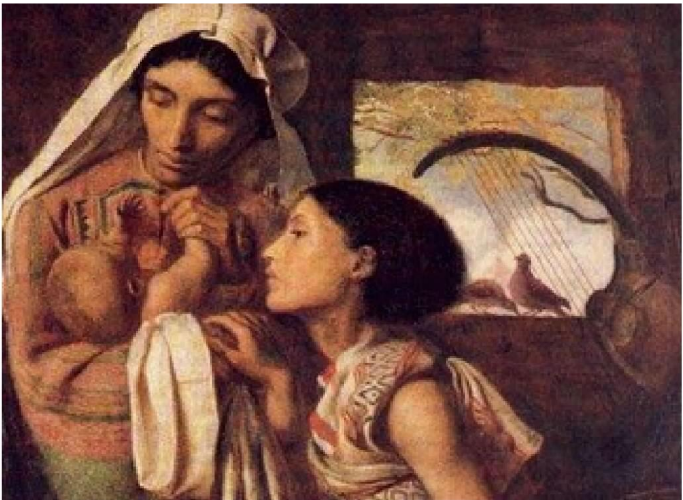
Jochebeth met baby Mozes

Het gebeurde in de tijd dat het volk Israëel werd verdrukt door de Egyptenaren.... Er was een man. Zijn naam was Amram. Die man had ook een vrouw. Haar naam was Jochebeth. Amram en Jochebeth behoorden tot de stam van Levi. Ze hadden ook kinderen. Een jongen en een meisje: Aäron en Mirjam. In de dagen dat alle joodse jongetjes moesten verdronken worden was moeder Jochebeth in verwachting. Er zou