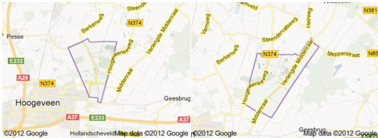
Gemeente –Tiendeveen - in kader

deze vrienden denk ik met blijdschap en dankbaarheid terug. Een eindje boven Hoogeveen liggen de plaatsjes Tiendeveen en Nieuw Ballinge. In deze plaatsen heeft