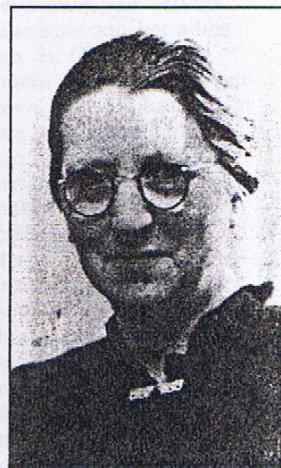
Na het overlijden van zijn vrouw, trad ds. Overduin in 1938 in het huwelijk met mevr. W. Boomgaards.

Ds. Overduin was wel iemand met independentistische gevoelens, dat wil zeggen iemand die zich maar slecht kon schikken in de regels van een kerkverband. Hij hield dan ook niet van de wat strakere ordening zoals die met name na 1907 in de Gereformeerde Gemeenten gevonden werd. Een bron van onenigheid op de kerkelijke vergaderingen was steeds zijn gewoonte om overal te gaan preken waar men hem maar vroeg. Zijn devies daarbij was steeds: Predik het Evangelie aan alle creaturen! Wie het preken buiten het eigen kerkver-